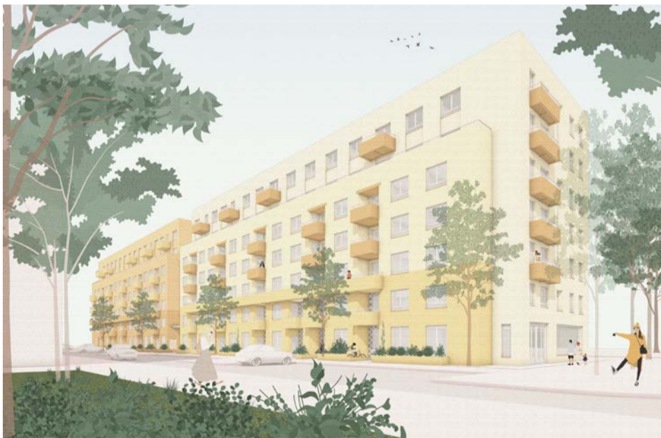
Schetsontwerp van de nieuwbouw (nog niet definitief)

Bewoners van Notweg 4-30 kunnen vanaf 3 februari 2026 met stadsvernieuwingsurgentie verhuizen naar een andere woning in Amsterdam. Dit betekent dat zij vanaf deze ‘peildatum’ voorrang hebben in DÂK Amsterdam (van WoningNet) bij het reageren op woningen. Zij hebben hiervoor 1,5 jaar de tijd. Daarna start Stadgenoot met de sloop van de woningen. Afspraken over (terug) verhuizen staan in het sociaal plan dat Stadgenoot samen met de bewoners maakte.