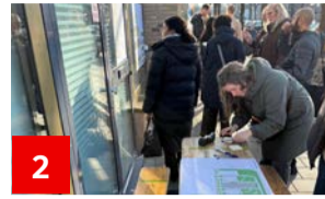
2 Openbare ruimte Hoeken es