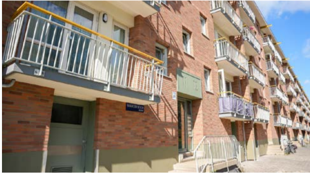
Verduurzaamde woningen aan de Braak en Bosch