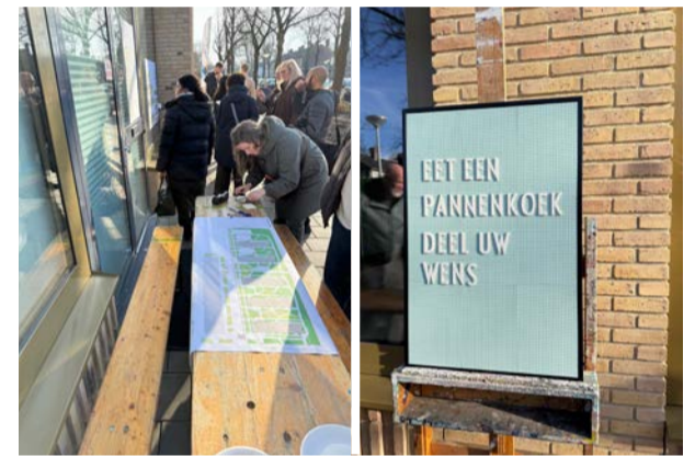
Op 17 januari konden bewoners hun reactie geven op het ontwerp

We verwachten dat het dagelijks bestuur van stadsdeel Nieuw-West het voorlopig ontwerp voor de zomer vaststelt.