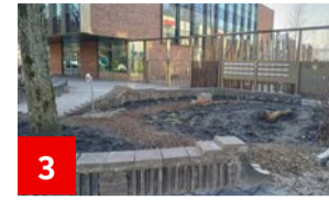
3 Wildemanbuurt stukje groener