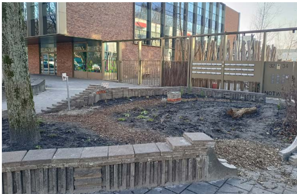
Nieuwe pluktuin bij IKC Het Talent