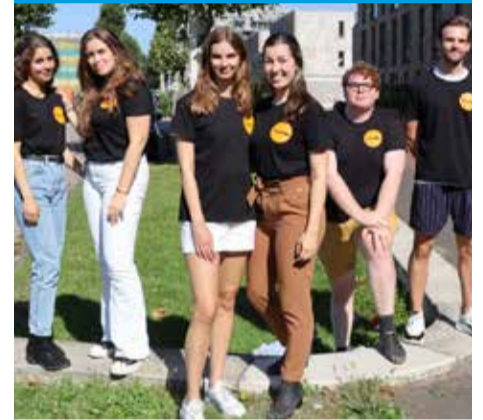
De jongeren van Vooruit

Kent u de studenten van Vooruit al? Zij organiseren allerlei activiteiten in de buurt, voor jong en oud. Van fietsles, tot taallessen, voorlezen en samen afval prikken. Of kom gezellig langs voor een kopje koffie. De activiteiten vinden plaats bij Station Wildeman of het Broekmanhuis. Voor meer info kunt u kijken op www.vooruitproject.nl/osdorp-de-wildeman-buurt/ U bent van harte welkom!