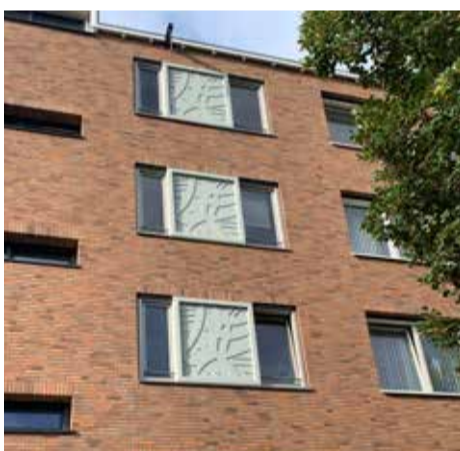
Vernieuwde entree en gevelversieringen