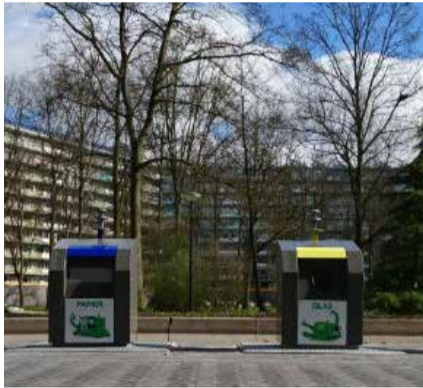
Amsterdamse ondergrondse afvalcontainer

Volle containers en afval naast ondergrondse afvalcontainers zijn voor veel Amsterdammers een grote ergernis. Dit geldt ook voor de inwoners van de Wildeman-en Blomwijckerbuurt. Hoewel iedereen telefonisch of via de website melding kan maken van een overvolle afvalcontainer kunt u als bewoner of groep bewoners nu ook een ondergrondse afvalcontainer adopteren.