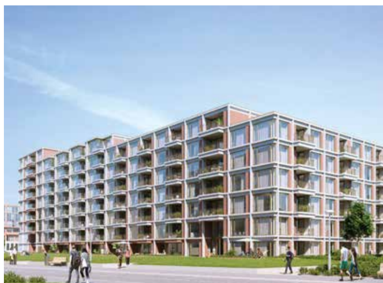
Impressie van appartementencomplex The Ox