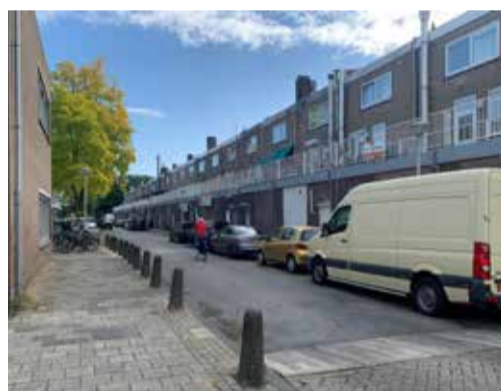
De Nieuwe Laan, de straat wordt in 2022 opnieuw ingericht

Volgend jaar worden de straten Vrijburg en Nieuwe Laan vernieuwd (zie nummer 4 op de projectkaart). Vlak voor de zomer is het ontwerp besproken met de buurt. De opmerkingen uit de bijeenkomst zijn zoveel mogelijk meegenomen in het definitieve ontwerp, zoals extra fietsparkeercapaciteit. Het ontwerp kunt u bekijken via www.amsterdam.nl/projecten/nieuwe-laan-vrijburg/ . Het dagelijks bestuur van stadsdeel Nieuw-West moet het ontwerp nog vaststellen. In het voorjaar van 2022 starten de werkzaamheden. Dat duurt ongeveer een half jaar omdat er ook werk is aan de kabels en leidingen onder de grond. Er wordt zoveel mogelijk geprobeerd om de woningen en bedrijven bereikbaar te houden.