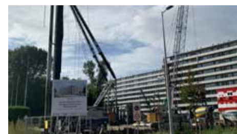
Werkzaamheden zijn in volle gang