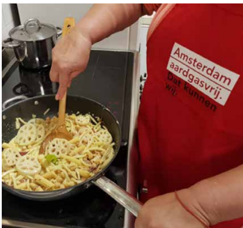
Van koken op gas naar koken op inductie.

Alle woningen en gebouwen in de Wildeman- en Blomwijckerbuurt worden vòòr 2030 aardgasvrij. Dit betekent dat je geen gas meer gebruikt voor warm water, verwarming en koken. Huurders krijgen als het zover is een voorstel van de corporatie, waarmee gevraagd wordt of ze hiermee in kunnen stemmen. Woningeigenaren kiezen zelf op welk warmte-alternatief ze overstappen. De nieuwbouw woningen die in de Wildeman-en Blomwijckerbuurt gebouwd worden hebben al geen aardgasaansluiting meer.