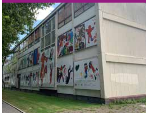
Notweg 32 wordt in 2022 verbouwd naar jongerenwoningen

Het pand is overgedragen aan woningcorporatie Stadgenoot. Stadgenoot heeft voor deze verbouwing in mei 2021 een omgevingsvergunning aangevraagd. Medio 2022 wordt gestart met de verbouwing van het pand. In 2023 is het pand klaar voor gebruik.