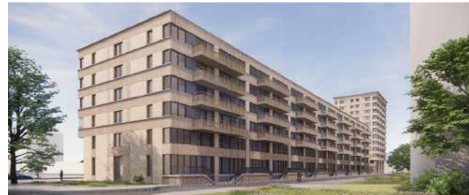
Impressie van nieuwbouw Groenehuysen, gezien van het Blomwijckerpad

De gymzaal is voor basisschool IKC het Talent en is buiten schooltijden beschikbaar voor sportverenigingen en sportieve buurtinitiatieven. Op 3 en 31 maart heeft de gemeente informatiebijeenkomsten georganiseerd voor de buurt. Voor de inrichting van de openbare ruimte rond de gymzaal en het lichtkunstwerk dat er komt, organiseert de gemeente later aparte bijeenkomsten. Na de zomervakantie komt daar meer informatie over. Meer informatie over de omgevingsvergunning en de procedures vindt u binnenkort op amsterdam.nl/wildeman-blomwijcker (onder Deelprojecten).