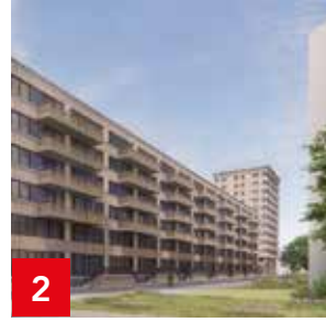
2 Groenehuizen: vernieuwing van start