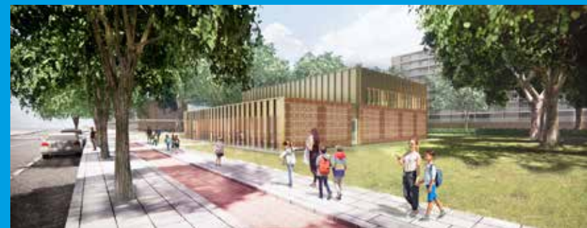
Impressie van de Gymzaal, gezien vanaf de Osdorper Ban