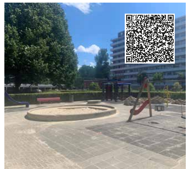
Naast deze speeltuin, komt een nieuw speelplek

Eind 2022 moet het vernieuwde plein klaar zijn. Binnenkort krijgen jongeren uit de buurt een uitnodiging om mee te denken over de nieuwe ondergrond. U kunt u hiervoor aanmelden bij projectleider Gallyon: g.ide@amsterdam.nl