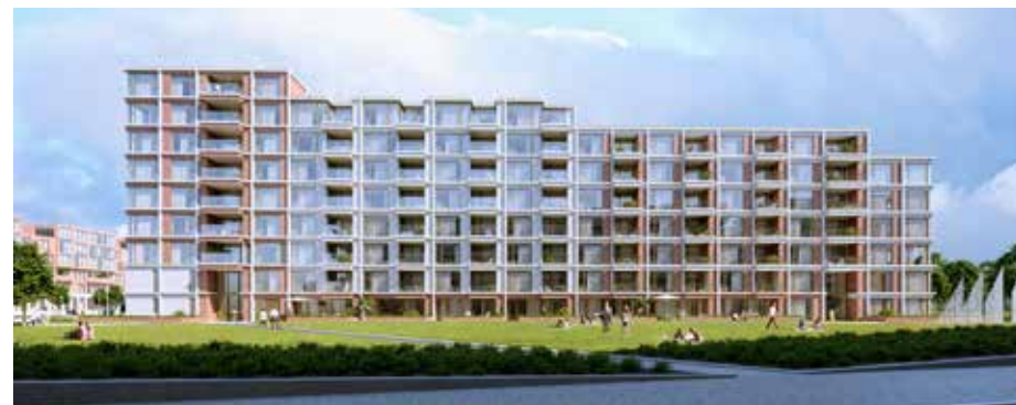
Nadat nieuwbouw van The Ox in 2023 gereed is, zal de openbare ruimte eromheen worden opgeknapt.

Het ontwerp is gebaseerd op het gebied ten noorden van de Osdorper Ban. Omwonenden konden op verschillende manieren hun mening geven over het ontwerp. Ook was er op 31 maart een inloopavond. Er zijn geen reacties binnengekomen. Het ontwerp wordt nu geagendeerd bij het stadsdeelbestuur van het stadsdeel.