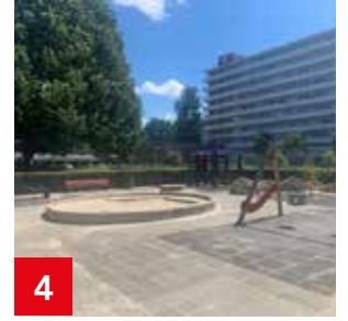
4 Vernieuwde speelplek Remijden