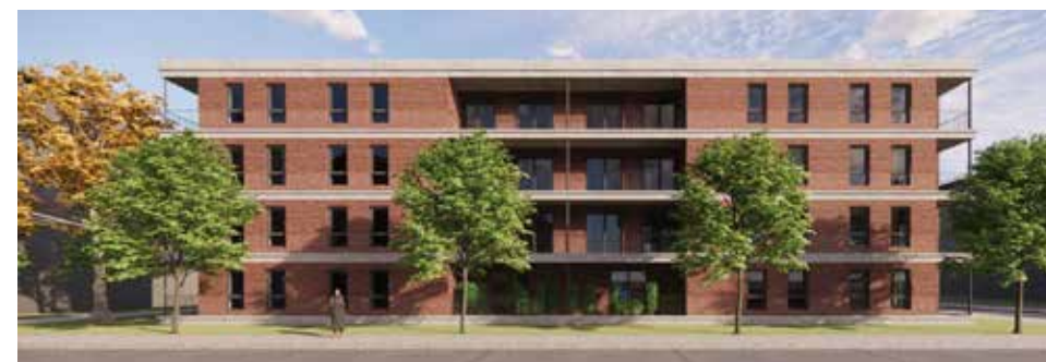
Impressie van de nieuwbouw aan het Blomwijckerpad

Het plan voor vernieuwing van de Hoekenes wordt nu al voorbereid. Besluitvorming hierover kan plaatsvinden zodra er duidelijkheid is hoe de parkeerdruk kan worden aangepakt. Die duidelijkheid verwachten we in 2023 te kunnen geven, waarna er vervolgens eind 2023 met de herhuisvesting kan worden gestart.